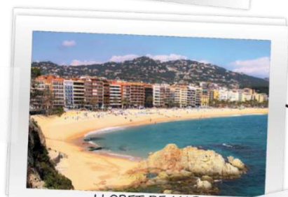
LLORET DE MAR